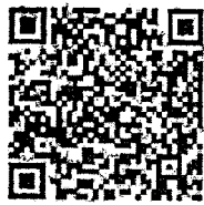
แบบฟอร์มรายงาน