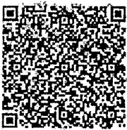
แบบสอบถามฯ

โดยขอให้องค์กรปกครองส่วนท้องถิ่นดำเนินการตอบแบบสอบถาม ภายในวันที่ ๓๐ เมษายน ๒๕๖๗ ทั้งนี้ ขอให้จังหวัดที่ดำเนินการครบถ้วนแล้ว รายงานผลการดำเนินงานตามแบบฟอร์มที่กำหนด รายละเอียดปรากฏตาม QR Code ท้ายหนังสือฉบับนี้