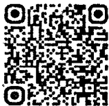
QR Code สำหรับ ดาวน์โหลดเอกสาร