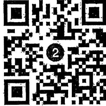
Qr Code เข้าสู่ระบบ Zoom หรือ Meeting ID : 339 538 1914 Passcode : DWF12345 ครั้งที่ ๒ ภาคกลาง