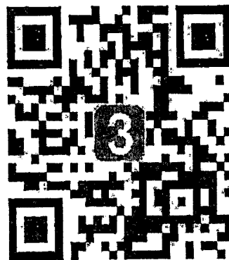
Qr Code เข้าร่วม Zoom หรือ