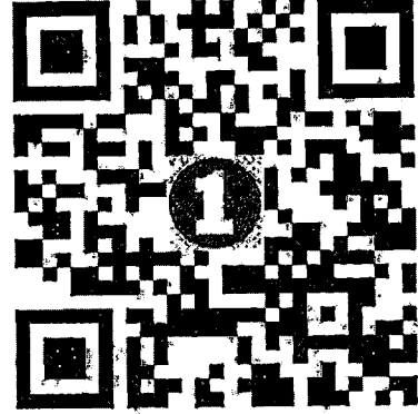
Qr Code เข้าร่วม Zoom หรือ