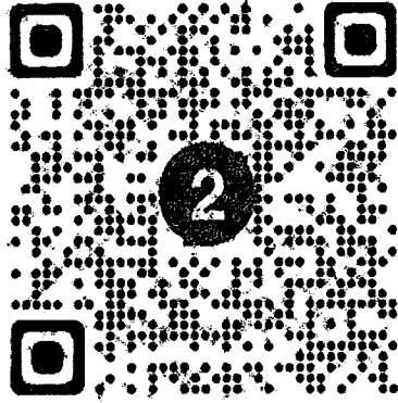
Qr. Code แบบตอบรับ ครั้งที่ ๒ ภาคกลาง

การประชุมเชิงปฏิบัติการพัฒนาศักยภาพการปฏิบัติงาน นายทะเบียนสมาคมมาปนกิจสงเคราะห์ประจำท้องที่ ผ่านสื่ออิเล็กทรอนิกส์ ครั้งที่ ๒ ภาคกลาง วันพุธที่ ๑๕ กุมภาพันธ์ ๒๕๖๗ เวลา ๐๘.๓๐ - ๑๖.๓๐ น.