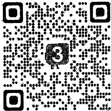
Qr Code แบบตอบรับ ครั้งที่ ๓ ภาคตะวันออกเฉียงเหนือ

การประชุมเชิงปฏิบัติการพัฒนาศักยภาพการปฏิบัติงานนายทะเบียน สมาคมฌาปนกิจสงเคราะห์ประจำท้องที่ ผ่านสื่ออิเล็กทรอนิกส์ ครั้งที่ ๓ ภาคตะวันออกเฉียงเหนือ จันทร์ที่ ๒๑ กุมภาพันธ์ ๒๕๖๗ เวลา ๐๘.๓๐ - ๑๖.๓๐ น.