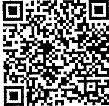
QR code ตรวจสอบรายชื่อ